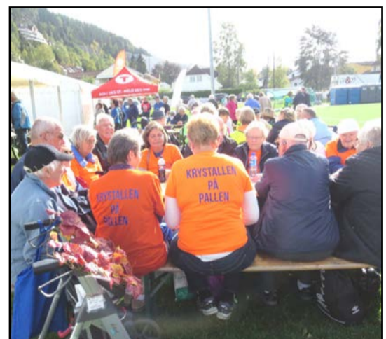
Dette bildet er fra fjoråret, men vi håper på å oppnå den stemningen i år også!